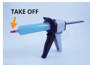
④ Take off the plug.

(The putty in the picture does not represent the actual product.)