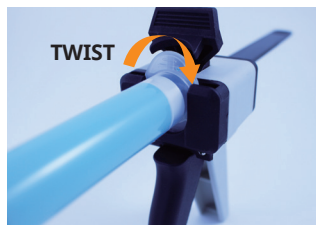
② Put the tube in and twist.