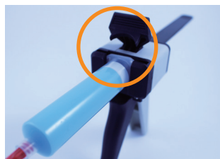
③ Close the cover.