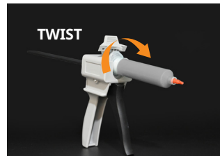
② Put the tube in and twist.