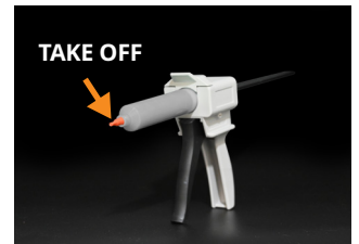
④ Take off the plug.

(图中操作步骤所展示的胶泥仅供示意 The putty in the picture does not represent the actual product.)