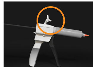
③ Close the cover.